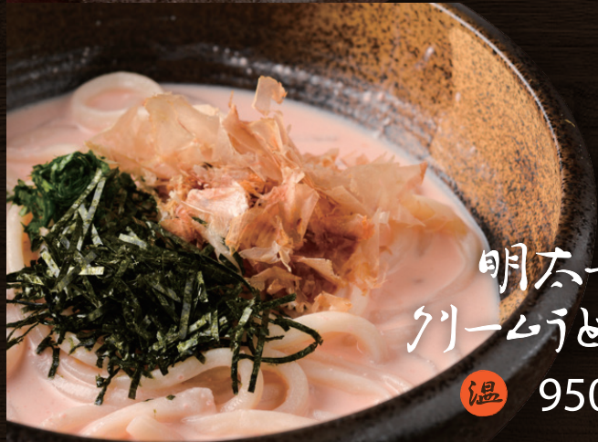
明太子 クリームうどん 温 950円