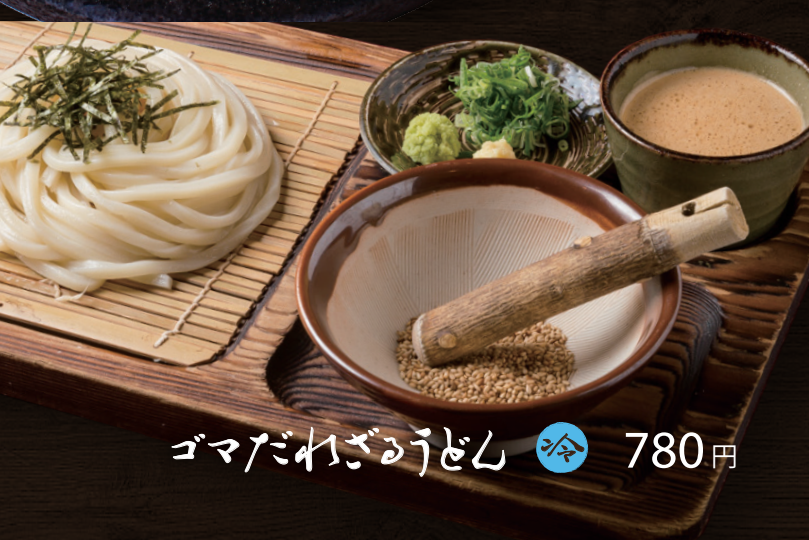
ゴマだれざるうどん 冷 780円