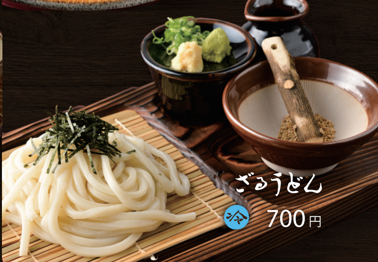
ざるうどん 冷 700円