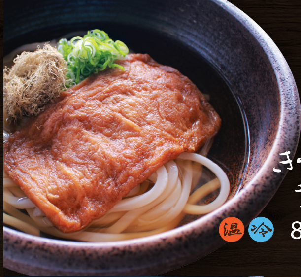
子つね うどん 温冷 850円