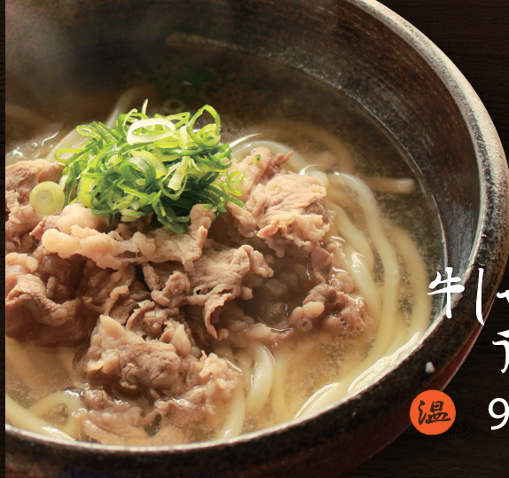
牛しゃぶ うどん 温 950円