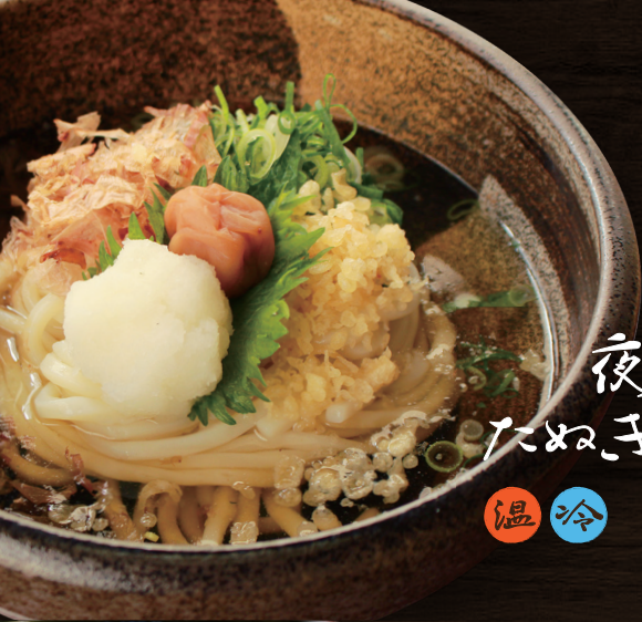
夜泣子 たぬ子うどん 温冷 850円