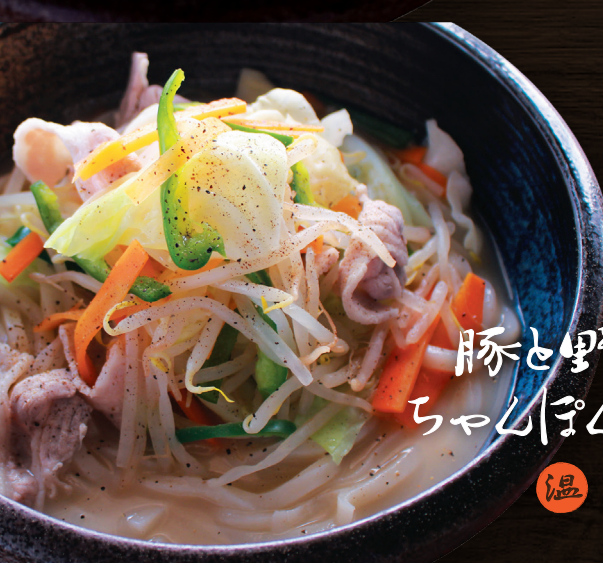
豚と野菜の ちゃんぽんうどん 温 900円