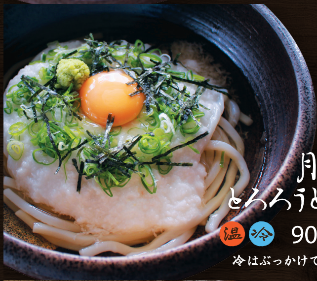
月見 とろろうどん 温冷 900円 冷はぶっかけで提供