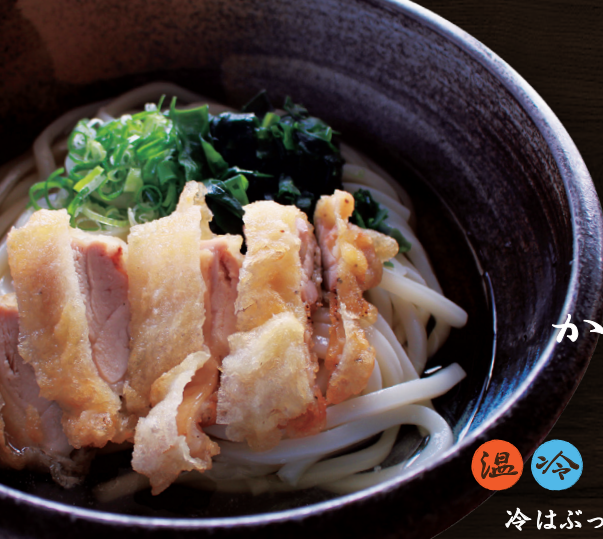
かわ天 うどん 温冷 1100円 冷はぶっかけで提供