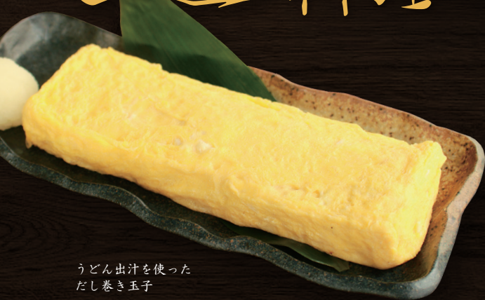
うどん出汁を使った だし巻き玉子