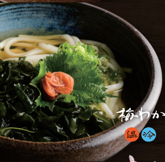
紀州 梅わかうどん 温冷 850円