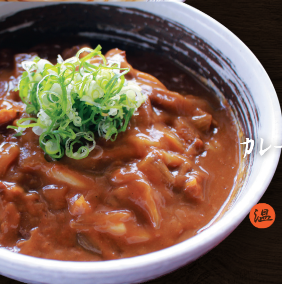
カレー南蛮 うどん 温 950円