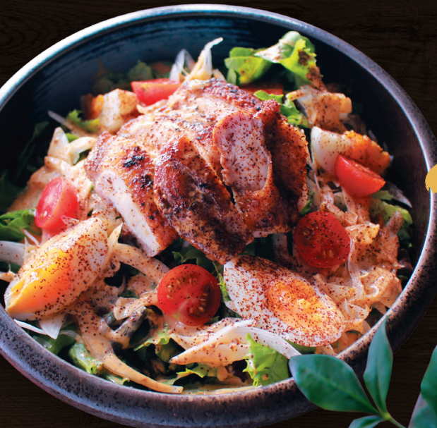
ケイジャンチキンの コブサラダ