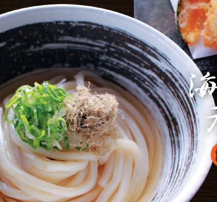
海老と旬菜の 天麩羅うどん 温冷 1,200円 冷はざるで提供