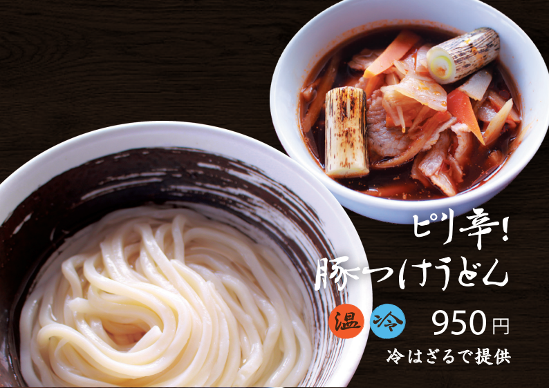
ピリ辛! 豚つけうどん 温冷 950円 冷はざるで提供