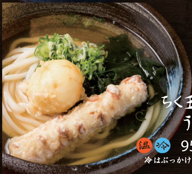
ちく玉天 うどん 温冷 950円 冷はぶっかけで提供