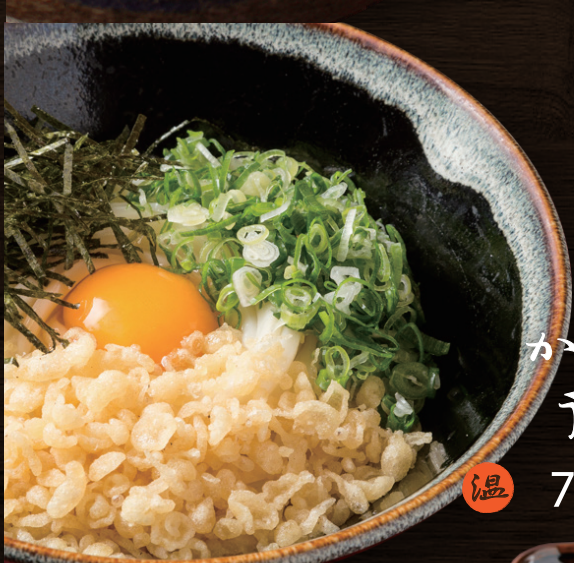
かま玉 うどん 温 780円