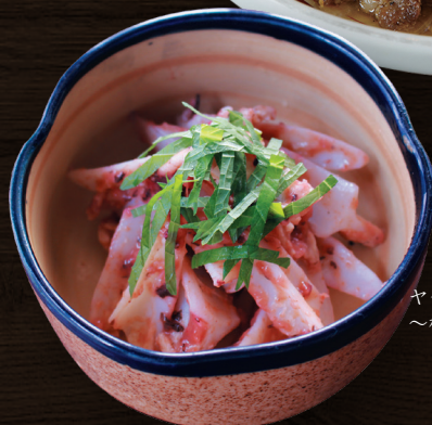
ヤゲン軟骨の梅和え 〜梅水晶風〜