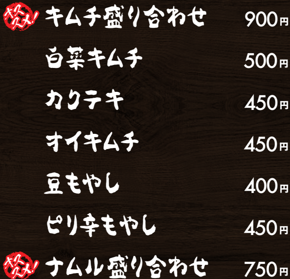
キムチ盛り合わせ